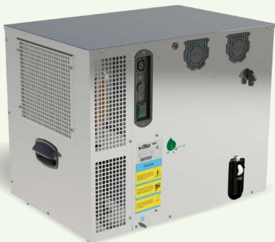
GEO horizontal GEO orizzontale